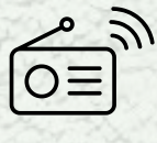
APARELHO DE RÁDIO